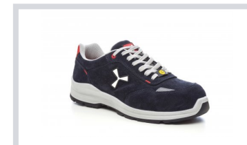
S0301 BLU NAVY