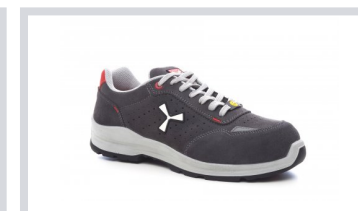
S1005 STEEL GREY