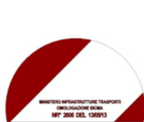
DETTAGLIO A SCALA 2 : 5